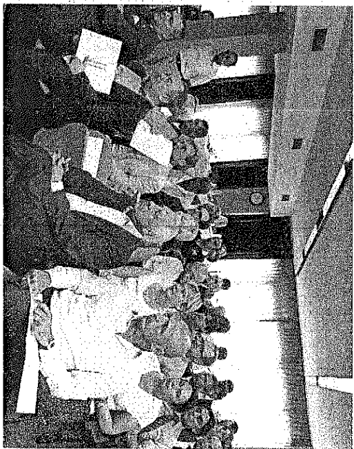
Il pubblico che ha partecipato presso la sede della Camera di commercio all'iniziativa

sidente», poiché il nostro è un territorio fertile di eccellenze, quella locale non è per niente una scelta di ripiego, ma anzi, è una scelta all'insegna della qualità».